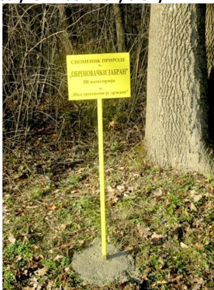
Фотографија бр. 1. изглед табле – ознаке

Метални носач – висине након постављања (укопа) 50 cm изнад земље, дакле 50 cm и потребна додатна дужина за укуп – бетонску стопу.