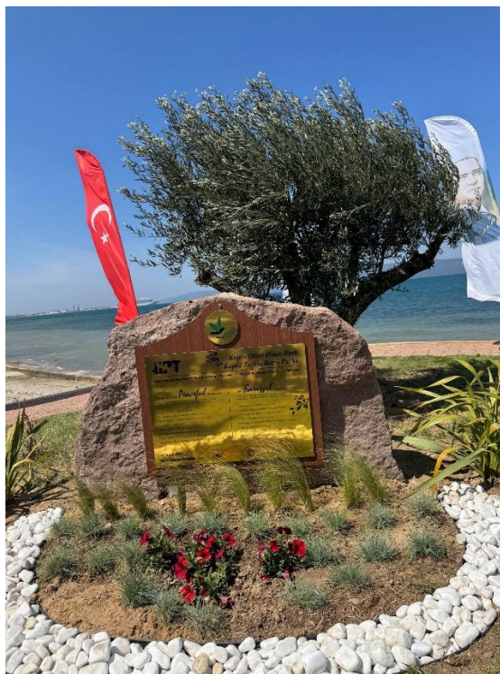
Фотографија бр. 3 – Пример изгледа табле