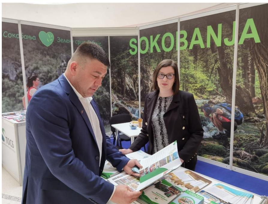
Сл. бр. 5 - Детаљ са Сајма туризма у Бања Луци - април 2022.

Туристичка организација Сокобања, посебно ће представити понуду и кључне манифестације које ће се током лета одржати у Сокобањи на догађајима у организацији Туристичке организације Србије у оквиру домаће кампање и регионалним наступима на догађајима у суседним земљама, које организује ТОС, а посебно у земљама секундарног туристичког тржишта, као што су Румунија, Грчка, Мађарска, Македонија, Бугарска у случају њиховог одржавања.