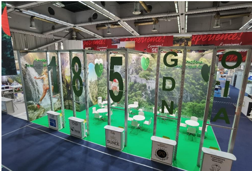
Сл. бр. 4 – Детаљ промоције Сокобање – Штанд Сокобање на београдском сјаму туризма 2022.

Узимајући у обзир да је директна промоција туристичког производа Сокобање на сајмовима и изложбама увек давала добре резултате, због велике посећености оваквих врста манифестација и добро организоване промоције са главним носиоцима понуде и Туристичком организацијом Србије у 2023. години у плану су наступи на: