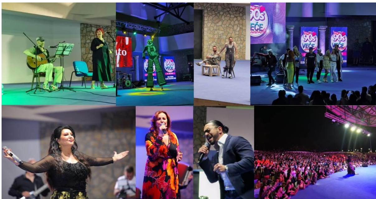
Сл. бр. 6 – Део извођача који су наступили у Сокобањи током лета 2022. године у организацији Туристичке организације Сокобања

Једна од главних активности биће организовање догађаја у новоизграђеном мултифункционалном комплексу „Летње позорнице „Врело“ (МФК ЛП „Врело“), чија је изградња завршена новембра 2019. године, а у складу са препорукама и упутствима Кризног штаба Владе републике Србије за сузбијање болести COVID19.