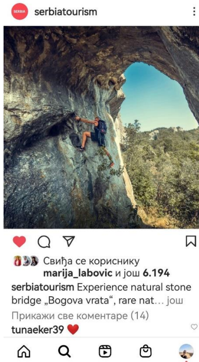
Сл. бр. 10 – Део кампање ТОС-а на друштвеним мрежама - мај 2022.

spring, one of the most beautiful s... још 09. мај