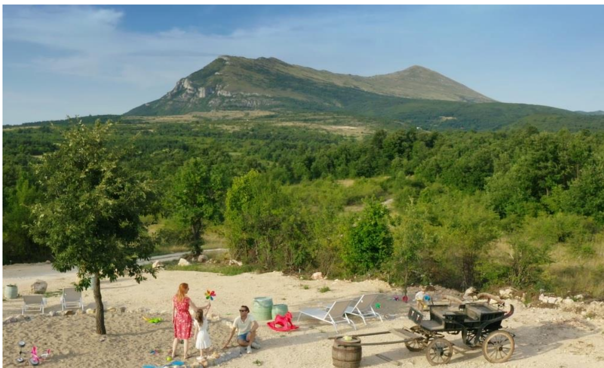
Сл. бр. 3 – Део кадрова награђеног промо филма

У складу циљевима Туристичке организације Сокобања у плану је спровођење следећих промотивних активности: