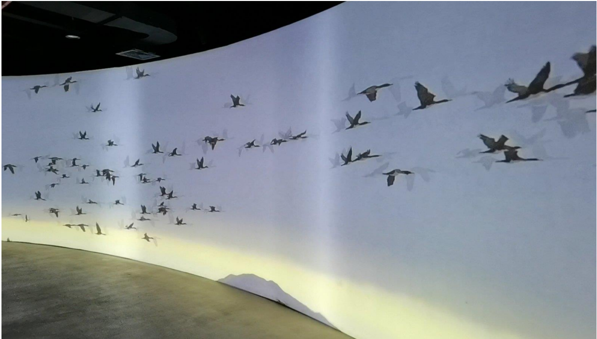
Сл. бр. 8 – Планирана набавка и монтажа ЛЕД постера у МФК „Врело“

и иностраних фондова у области културе, а опет у сврхе подизања атрактивности Сокобање као туристичке дестинације, повезивање туристичке понуде са културним идентитетом Сокобање, кроз афирмацију властите културне баштине, (попут концерата, традиционалних манифестација, фестивала, гостовања познатих глумаца, позоришта, изложби, и др.). У 2023. години ТОСБ наставиће даље опремање објекта, набавком неопходне опреме за унапређење организовања догађаја и инфомисања туриста. У плану је потпуно опремање и додатном расветом (како би се дугорочно смањили трошкови изнајмљивања, обука једног лица које ће руковати опремом.