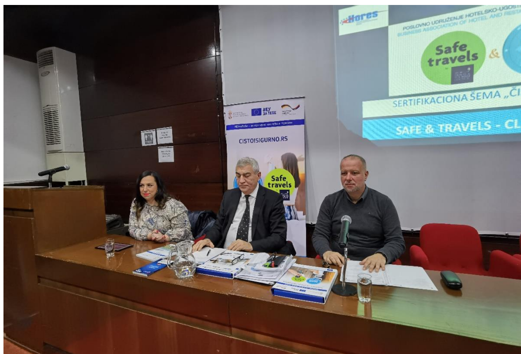
Сл. бр. 3 – Едукативни тренинзи одржани угоститељима и станодавцима у Сокобањи у сарадњи ТОСБ и ХОРЕС-а, из пројекта „чисто и сигурно“ (#ЕУ за тебе, ГИЗ)

Полазећи од основних циљева Туристичке организације Сокобања, активности Организационог дела за туризам у 2023. години биће усмерене на развој и промоцију као и даље унапређење туристичке понуде Сокобање. Планом рада за 2023. годину посебно су дефинисане промотивне активности које ће, пре свега, бити усклађене са Маркетинг планом Сокобање, 2020 - 2025. и Стратегијским маркетинг планом туризма Србије (ТОС) 2019 - 2024. , а у складу са Ст 4. Чл 41, Закона о туризму Републике Србије. Обзиром на глобалну ситуацију у свету и нашој земљи, изазвану пандемијом болести COVID19, посебна пажња у 2023. години биће посвећена промоцији нових садржаја, усмерених ка конкретним циљним групама (породице са децом, рековалесценти након прележане болести COVID 19, дигитални номади...) и производа, посебно оних које у 2021. и 2022. години је није било могуће пласирати или оних који су делимично стављени у функцију туризма.