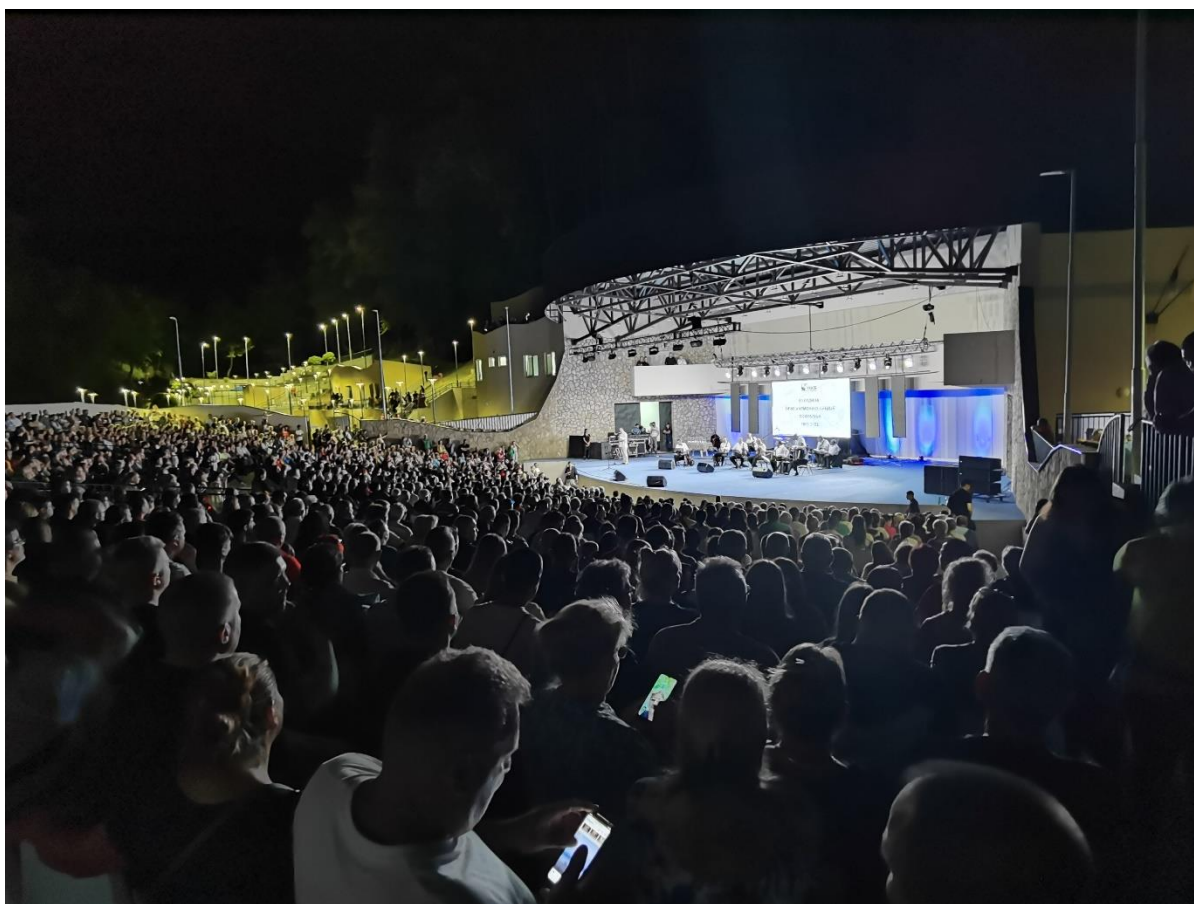
Сл. бр. 7 – МФК „Врело“ - Велика сцена

интересовања, за присуство догађајима, Туристичка организација Сокобања у 2022. години значајно је унапредила програм Бањског забавног лета за којима је највећа потражња, и током ове године укупна посећеност била је виша за чак 30% у односу на претходну годину. Из наведених разлога Туристичка организација Сокобања планира организовање Бањског забавног лета у 2023. години као скуп догађаја за којима је владало највеће интересовање. То су пре свега дечије и позоришне представе, три велика концерта, познатих соло извођача и група, али и летњи биоскоп. Када је у питању организовање филмских и других пројекција ТОСБ планира набавку пројекционе опреме (у 2022. години је набављено озвучење) како би самостално вршила приказивање блокбастера и ослатих пројекција, а не преко посредника како је то чинила до сада.