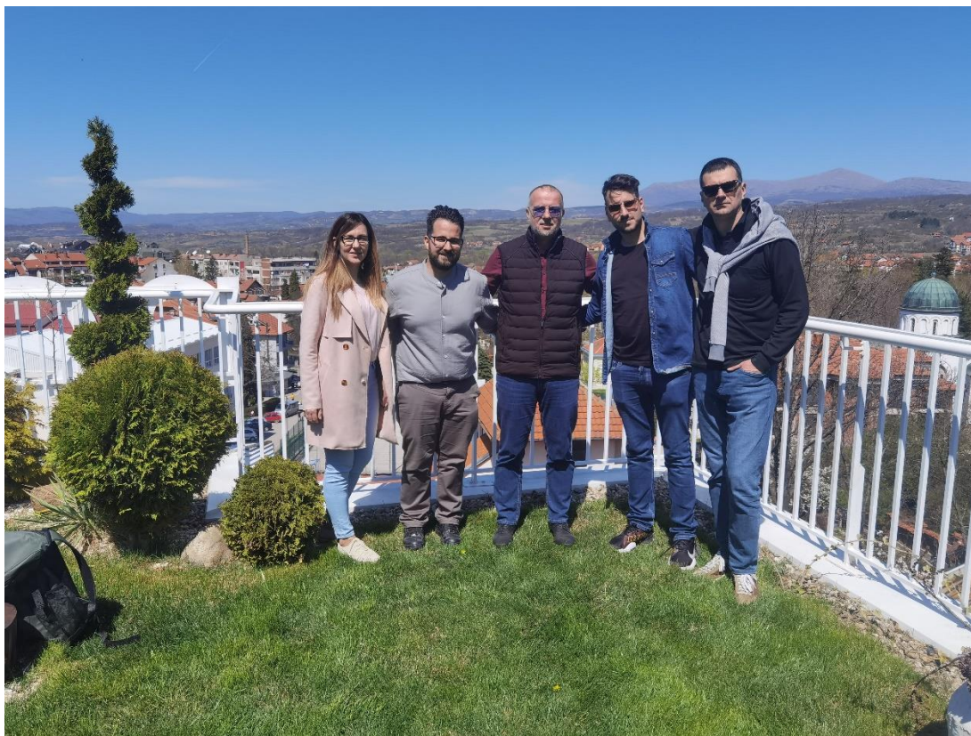
Сл. бр. 2 – Део интегрисане кампање Туристичке организације Србије и Туристичке организације Сокобања – Грчки инфлуенсери у обиласку Сокобање

- продукција, обезбеђивање и унапређење информативно-пропагандног материјала којим се промовишу туристичке вредности Сокобање (штампане публикације, аудио и видео промотивни материјали, дигитал и онлајн средства промоције, интернет презентације, друштвене мреже и пратеће дигиталне активности, сувенири, итд);