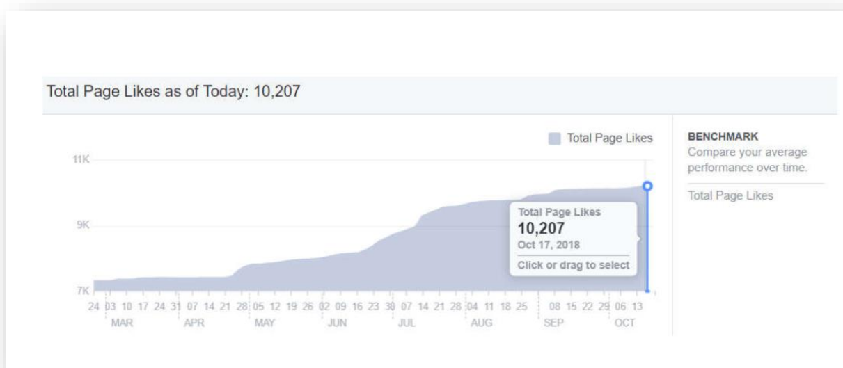
Сл. бр. 6 – Анализа резултата промоције Сокобање на друштвеној мрежи Фејсбук у 2019. години.

On - line комуникација у смислу контаката са потрошачима путем интернета односиће се пре свега на унапређење web презентација на адресама www.sokobanja.rs , www.sokobanjanje.rs , и www.tosokobanja.rs , www.prvaharmonika.rs и оглашавање на најпосећенијим web browser-има и коришћење алата као што је google addwords, односно бољем позиционирању на водећим browser-има и промоција на друштвеним мрежама Фејсбук, Твитер и Инстаграм. Средства опредељена за интернет маркетинг ће остати на прошлогодишњем нивоу, имајући у виду да је ово један од најисплативијих и најефектнијих видова маркетинга, који омогућава приказ великог броја објава и огласа одабраним циљним групама по веома ниској цени, уз бројне друге додатне ефекте као што су повећање посета на званичној интернет презентацији Сокобање ( www.sokobanja.rs ), повећање фанова на Фејсбук страници, већу видљивост објава на страници, већи број пратилаца на Инстаграму.