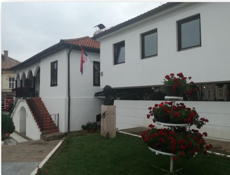
Сл. бр. 1 – Седиште Туристичке организације Сокобања, Сокобања, Ул. Трг ослобођења бр.2

ТОСБ реализује активности на развоју и промоцији туризма, координације активности носилаца туристичке понуде, привредних и других субјеката у туризму, на територији Општине Сокобања, као и друге послове из члана 41. Закона о туризму и активности у складу са одлукама оснивача и Статутом.