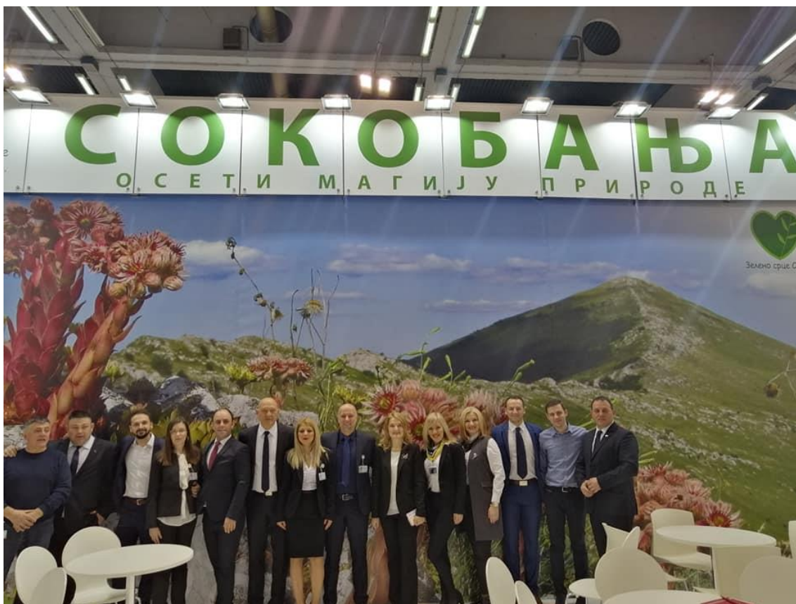
Сл. бр. 3 – Детаљ са штанда Сокобање на 42. Међународном сајму туризма у Београду 2020. године

Туристичка организација Сокобања, посебно ће представити понуду и кључне манифестације догађајима које организује Туристичка организација Србије у оквиру домаће кампање, на регионалним наступима у суседним земљама, које организује ТОС, а посебно у земљама секундарног туристичког тржишта, као што су Румунија, Грчка, Мађарска, у случају њиховог одржавања. Промоција манифестација ће посебан акценат