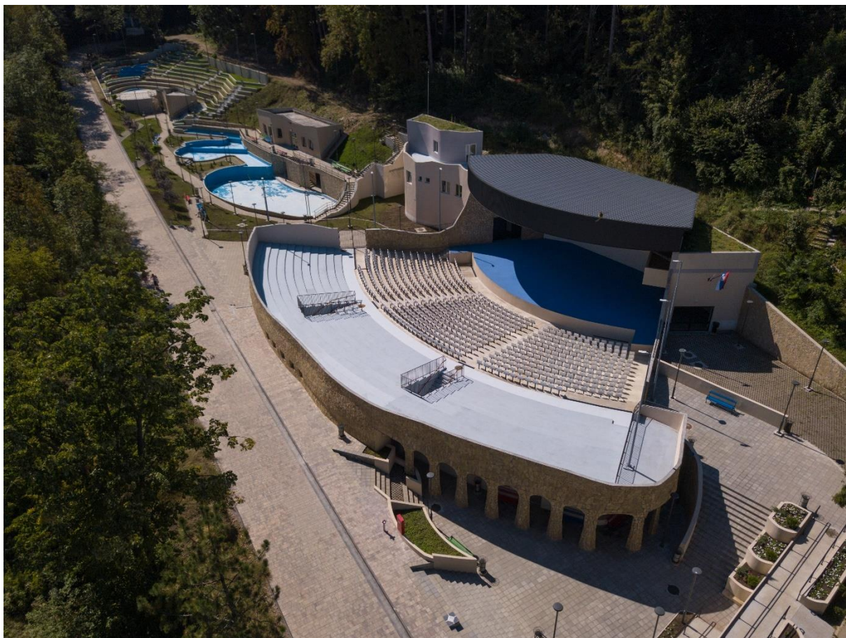
Сл. бр. 5 – МФК „Врело“

Нова летња позорница, отвара могућности за одржавање догађаја већег обима, унапређење квалитета организације традиционалних манифестација попут Међународног фестивала „Прва хармоника Сокобања и „Green Heart Fest-a“, али и нових могућности у смислу креирања „event -а“ профилисаних ка одређеним циљним групама туриста. Планом је предвиђено организовање свакодневних догађаја у објекту у складу са временским условима.